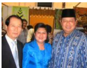
Ο πρόεδρος της Ινδονησίας, Susilo Bambang Yudhoyono και ο Περιφερειακός Διευθυντής της ICA Ασίας-Ειρηνικού, Shil-Kwan

γνωρίζοντας ότι αυτός ή αυτή συμμετέχει σε ένα τύπο επιχειρήσης, ένας για όλους και όλοι για έναν. Το αποτέλεσμα είναι ότι η διασφάλιση των θέσεων εργασίας αποτελεί προτεραιότητα, ακόμα και όταν αυτό σημαίνει ότι υπάρχουν ελάχιστα ή καθόλου κέρδη (μη κερδοσκοπικού χαρακτήρα)'. Οι συνεταιρισμοί έχουν επιζήσει από την κρίση, σε αντίθεση με πολλές άλλες επιχειρήσεις σε βασικούς κλάδους, διαπίστωσε ο Cassar.