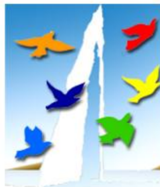
ica general assembly geneva 2009

είναι οι νέες προκλήσεις που αντιμετωπίζουν οι συνεταιρισμοί και πώς οι συνεταιρισμοί μπορούν να ωφεληθούν από τις ευκαιρίες που παρουσιάζονται από αυτές τις κρίσεις.