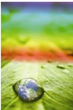
Εικόνα βασισμένη σε έργο τέχνης από το

‘Οι συνεταιρισμοί μπορούν να βοηθήσουν τραβώντας τον κόσμο από την ύφεση’