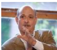
Ο Jeremy Rifkin — Βασικός ομιλητής στην Γ.Σ. της ICA