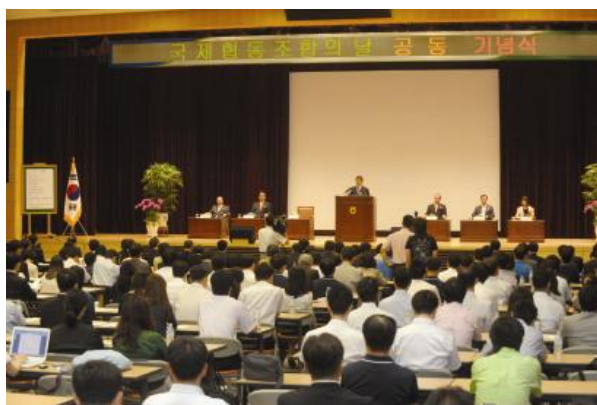
Η έναρξη του Συμβουλίου των Συνεταιρισμών Κορέας

Το νέο Συμβούλιο Συνεταιρισμών της Κορέας ξεκίνησε την λειτουργία του στις 3 Ιουλίου στα κεντρικά γραφεία της NACF, την κατάλληλη στιγμή για τους εορτασμούς της IDC. Το Συμβούλιο αποτελείται από έξι μέλη της ICA: Την Εθνική Ομοσπονδία Αγροτικών Συνεταιρισμών (NACF), την Εθνική Ομοσπονδία Δασικών Συνεταιρισμών, την Κορεατική Ομοσπονδία των Συνεταιρισμών