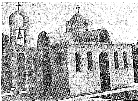
Η όμορφη εκκλησία του Αγ. Αλεξάνδρου στο χώρο της ΣΕΒΑΘ

Συνεχίζοντας την ευρύτερη κοινωνική της δραστηριότητα, η ΣΕΒΑΘ, ανήγγειρε στην Εάνθη, μέσα στο χώρο των εργοστασίων της, ιερό Ναό για τις θρησκευτικές ανάγκες των εκεί εργαζομένων. Τα θυρανοξιά του — που τιμά-