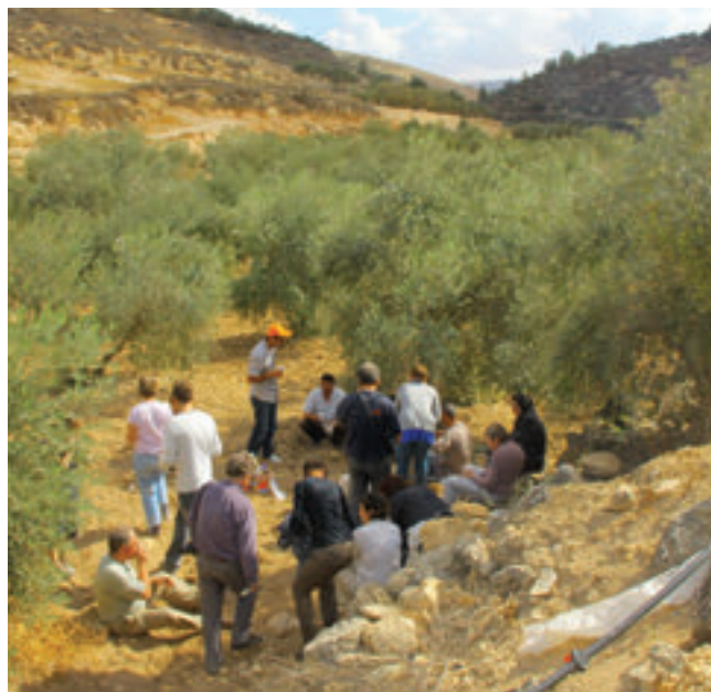
Η ανάγκη των μελών τους για υπηρεσίες ή για εργασία είναι ο πρωταρχικός σκοπός ίδρυσης των συνεταιρισμών.

Η εμπέδωση της διαφορετικότητας της συνεταιριστικής οικονομίας σε σχέση με την κρατική και την ιδιωτική διαδραματίζει βασικό ρόλο στην επιτυχή έκβαση ενός νέου συνεταιριστικού εγχειρήματος.